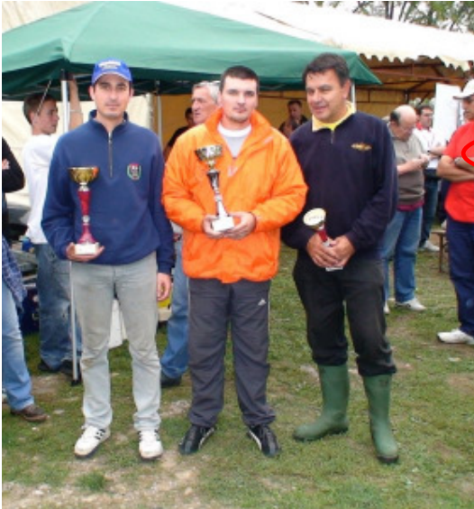
RESULTATS DE LA FINALE 3CC5